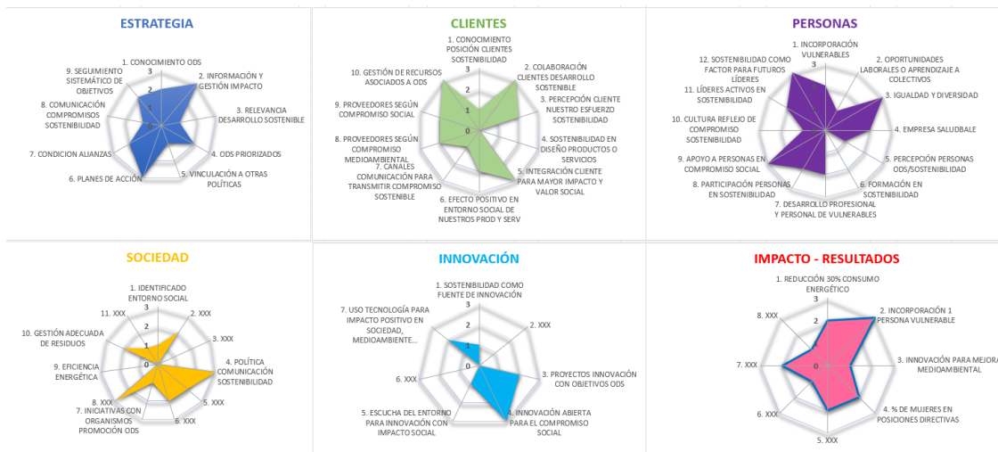
Imagen de la herramienta web. Grado de avance en cada uno de los elementos